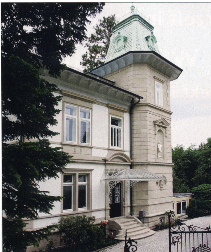
Hauptsitz der Trend@dress Medien AG in Baden-Baden

im Normalfall hat.“ Und auch die soziale Komponente, das so genannte Networking, ist nicht zu unterschätzen. „Viele unserer Kunden erhalten über die Suchmaschine größere Anfragen und knüpfen neue Geschäftsbeziehungen“, erzählt Goretzki. Zu den Kunden gehören neben großen Konzernen und dem klassischen Mittelstand auch kleinere Unternehmen. itsbetter.de hat sich im Markt etabliert. Aktuell läuft die vierte Version der Suchmaschine, die von den Entwicklern und Programmierern ständig weiterentwickelt wird. Mit